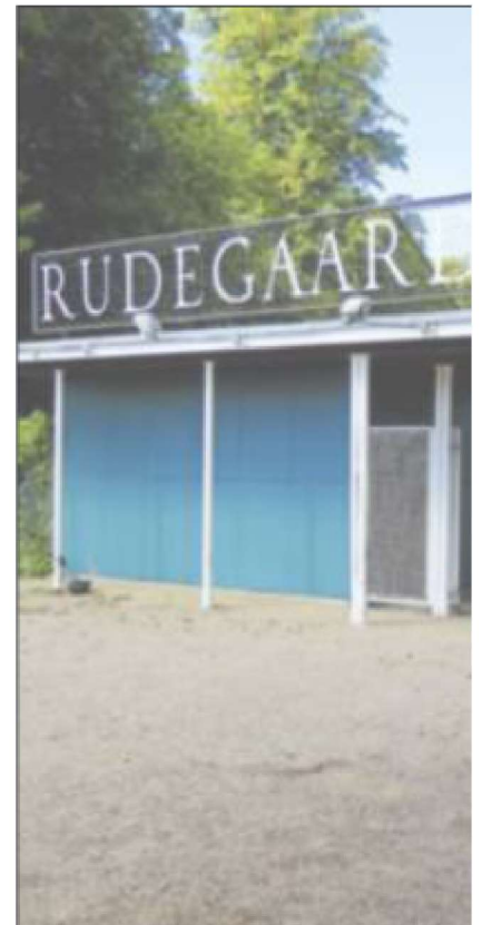
Det ser ud til, at en længe ventet Holtehal 3 på Rudegaard

"Det er meget positivt for foreningerne, at budgetpartierne nu genåbner deres aftale bare 14 dage senere og nu er