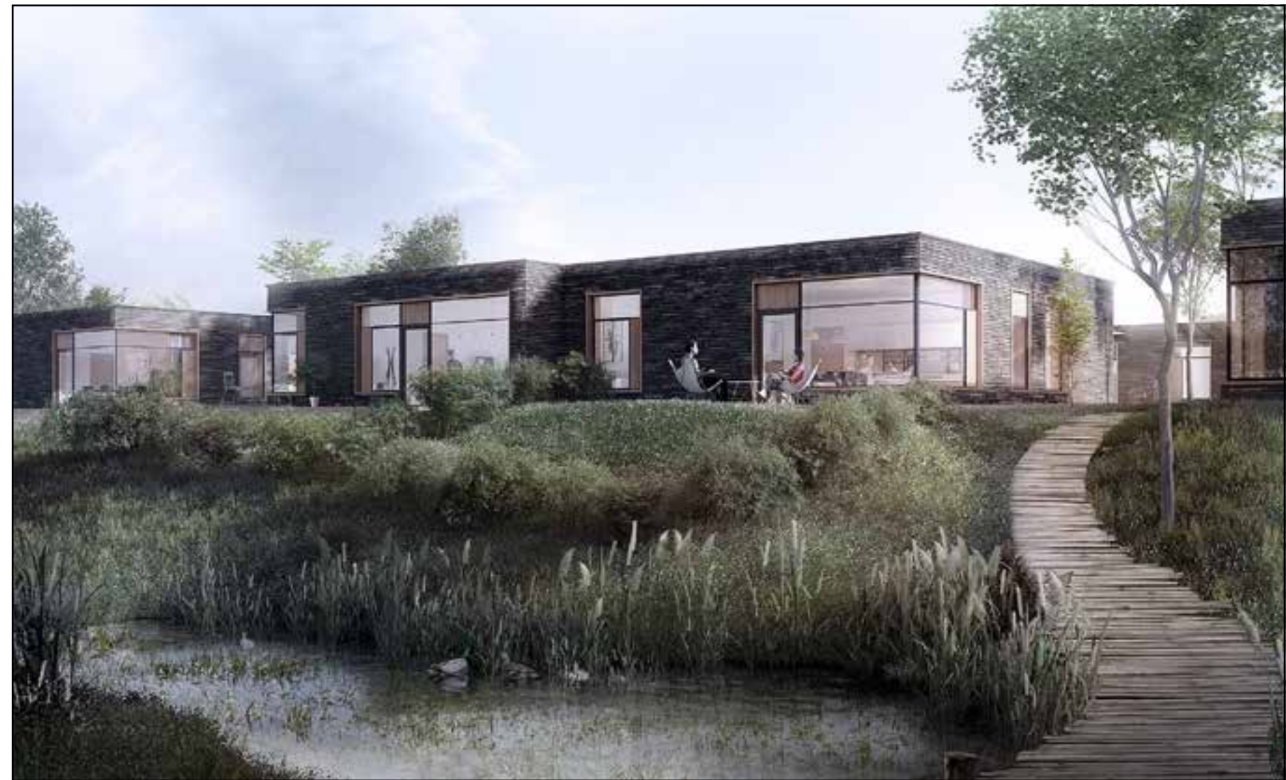
Øverst ses hvordan en privat bolig vil se ud, nederst ses en almen bolig i to etager.

Processen for de almene boliger er planlagt med byggestart i 2019 og en forventet byggetid på cirka et år.