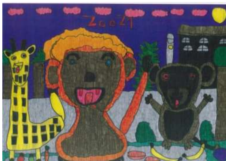
Af: Pernille Uglebjerg

Et meningsfuldt liv betyder, at du kan leve dit liv i overensstemmelse med din personlige opfattelse af livskvalitet, livsværdier og meningsfuldhed i livet.