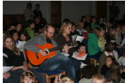
Fællessamling – Vi synger dansk