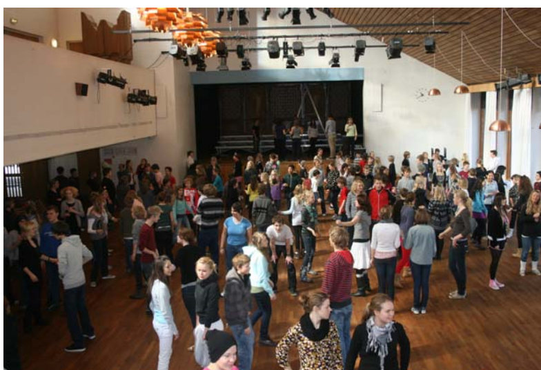
Udskolingens øver lancier til årets skolebal

På Toftevangskolen uddannes i skoleåret 08/09 en undervisningsvejleder til fagene matematik og engelsk. Toftevangskolen håber løbende at kunne tilmelde lærere til uddannelsen som undervisningsvejledere i de fag skoleområdet vælger. For at igangsætte arbejdet i de faglige miljøer afsættes i skoleåret 08/09 tid til det videre udviklingsarbejde i de faglige miljøer for bl.a. herigennem at støtte de ressourcepersoner, som allerede besidder den viden som svarer til uddannelsensom undervisningsvejledere og eller har lyst til at gå i gang før en evt. uddannelse til undervisningsvejleder kan igangsættes.