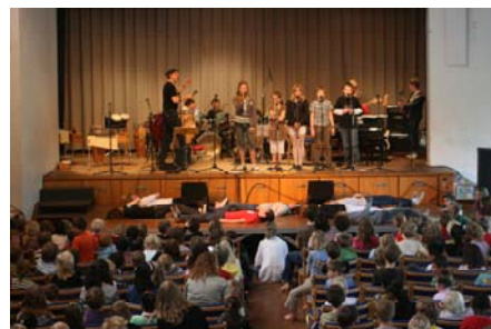
Forårskoncert 200 – 6. klasserne

Skolebestyrelsens principper og skolens retningslinier fremgår af skolens hjemmeside www.toftevang.skoleintra.dk