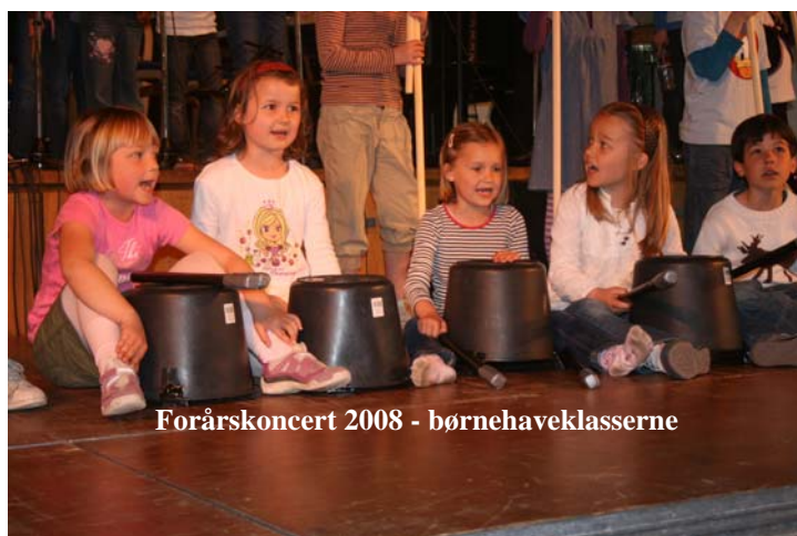
Forårskoncert 2008 - børnehaveklasserne

Skolens udearealer (skolegården) bærer stærkt præg af, at skolen blev ombygget og renoveret for 6 år siden. Under denne renovering blev skolegården brugt til opmagasinering af skurvogne/entreprenørmaskiner etc. Det betød at skolegårdens flisebelægning blev ødelagt. Den er i dag meget ujævn og en stor del af fliserne er knækkede. Skolen har derfor haft en del faldskader hos eleverne. Der er fremsat ønske overfor Skoleområdet om en anlægsbevilling til renovering af gården i størrelsesordenen 2 – 3 millioner kroner. Inkluderet i skolens ansøgning er udskiftning af en del af kloakrørene, da træernes rødder har ødelagt de gamle rør. Vedrørende det fysiske læringsmiljø henvises til afsnit C: "Læringsgrundlag" – 2.C.3 "Det fysiske læringsmiljø"