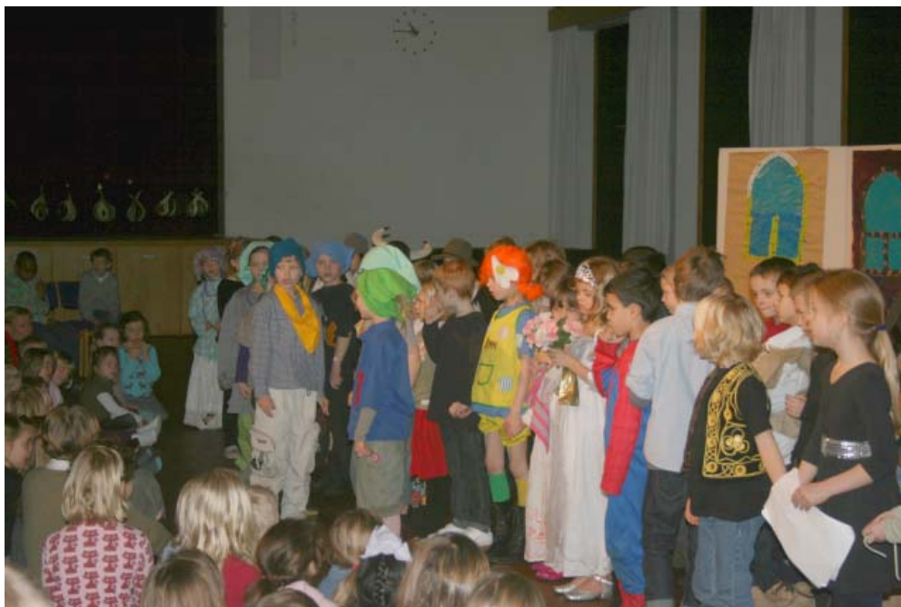
1.klasserne opfører H.C. Andersen teater