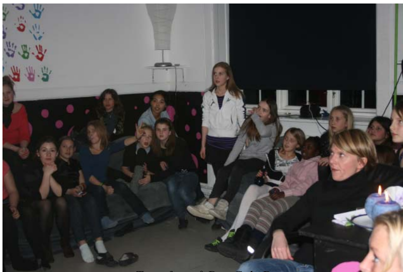
Tøseften på Den Gule Drage

som andet sprog samt øvrige nye handleplaner, som måtte blive udarbejdet af Skoleområdet.